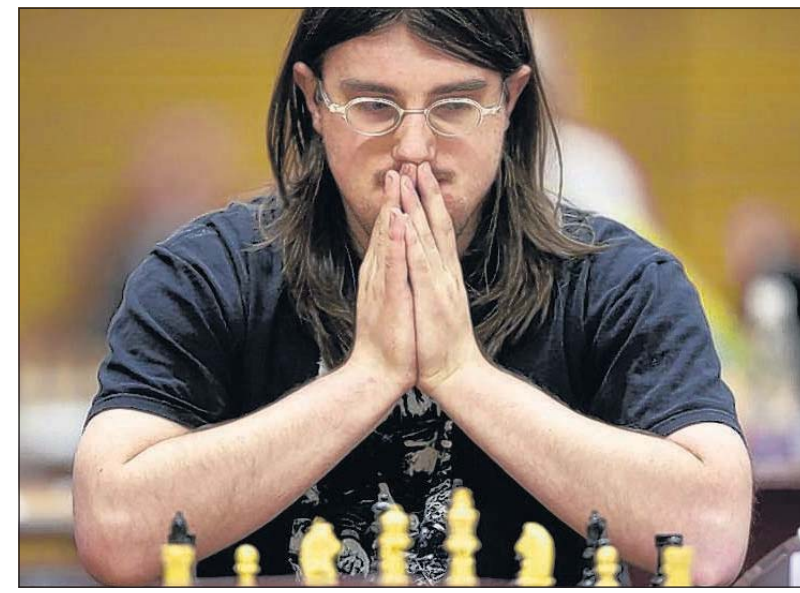
Opperste concentratie bij deze deelnemer aan het Limburg Open.