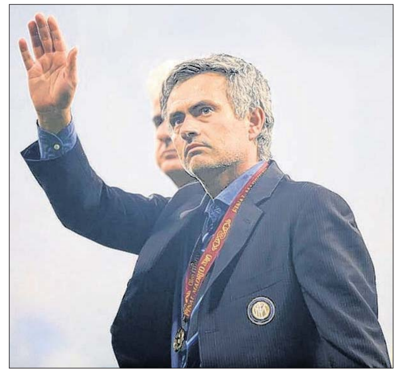
Inter-coach José Mourinho.