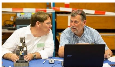
Een niet helemaal objectief beeld van de spanning bij het aanmelden

Tijdens het aanmelden zijn er altijd wel een paar spelers die niet komen opdagen of die bellen of mailen dat ze toch nog een bye willen aanvragen. Dat is dan ook de reden dat de indeling nog niet van tevoren kan worden gemaakt. Ook zijn er standaard een paar mensen die willen testen of de aanmeldingen daadwerkelijk sluiten om 18:30, of dat we zo coulant zijn dat we toch nog even op ze wachten. En vriendelijk als we zijn, doen we dat dan ook standaard. Dan kan zo tegen 18:45 onze arbiter aan de gang met de indelingen. Dat wil zeggen: de veranderde byes handmatig aanpassen, de no-shows handmatig een bye in ronde 1 geven en vervolgens voor 5 groepen de indelingen maken en ophangen.