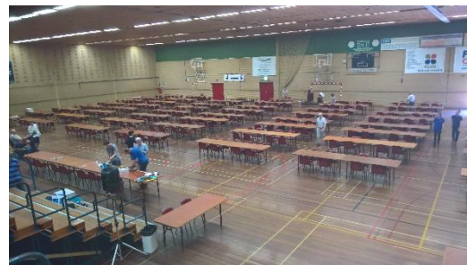
De tafels en stoelen staan, nu nog de borden en de aankleding

Van harte welkom op het 11 e BPB Limburg Open 2017! De lucht is strak blauw en de zon is fel als om 12:00 's middags zich 15 vrijwilligers melden in de Geusselthal in Maastricht. Wat is de feestelijke reden? Er mogen 150 tafels, 550 stoelen en een kleine 250 borden van een container buiten in de zon, naar een grote, doch warme speelzaal worden gesleept en gesjouwd. Tel daarbij op dat er 12 liveborden moeten worden aangesloten op het internet wat er nog niet is, en je hebt alles bij elkaar een behoorlijke klus. Toch is de sfeer goed, het aantal vrijwilligers rijk bezaaid, de starttijd vroeg genoeg en tegen een uur of 15:30 is de zaal zo goed als opgebouwd. En dat is maar goed ook, want hoewel de aanmeldingen pas om 16:30 beginnen, druppelen de eerste zenuwpezen al rustig binnen.