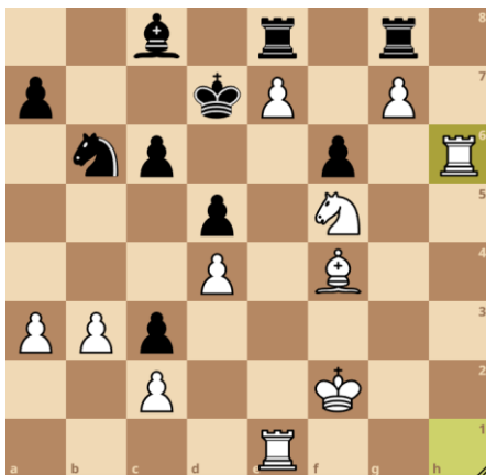
Stelling na 34. Th6.