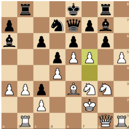
Stelling na 21. f5