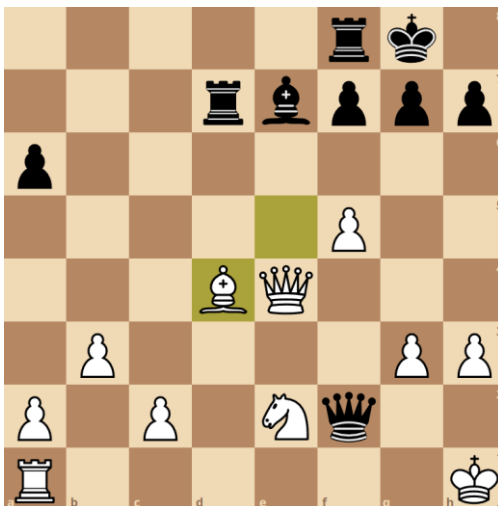
Stelling na 24. Ld4