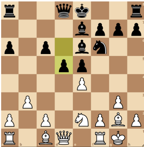
Stelling 11. ... d5