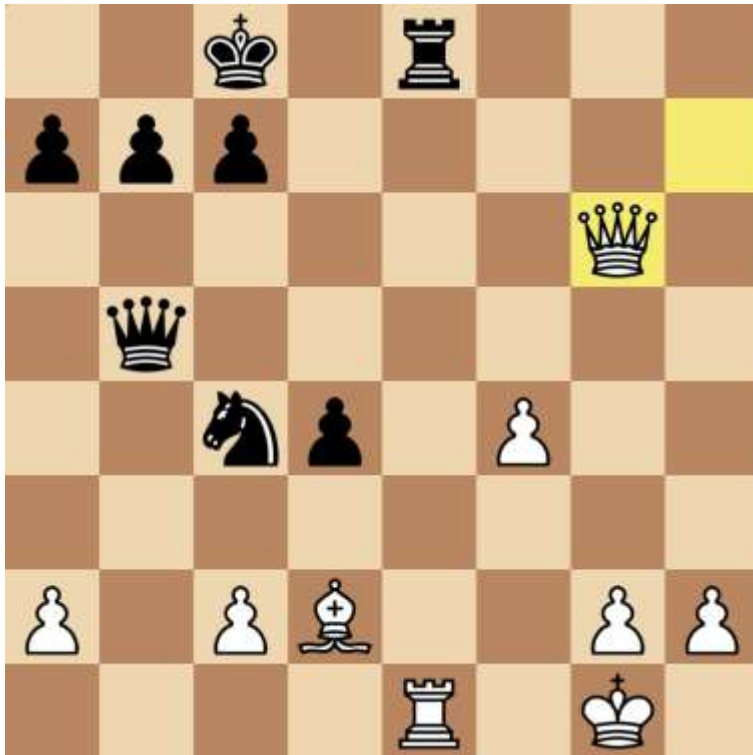
Stand na 21. Dxg6

Hier is een enorme disbalans in de stelling ontstaan. Wit heeft drie! vrijpionnen aan de koningskant, maar zwart heeft een meerderheid aan damevleugel en waarschijnlijk de betere stukken.