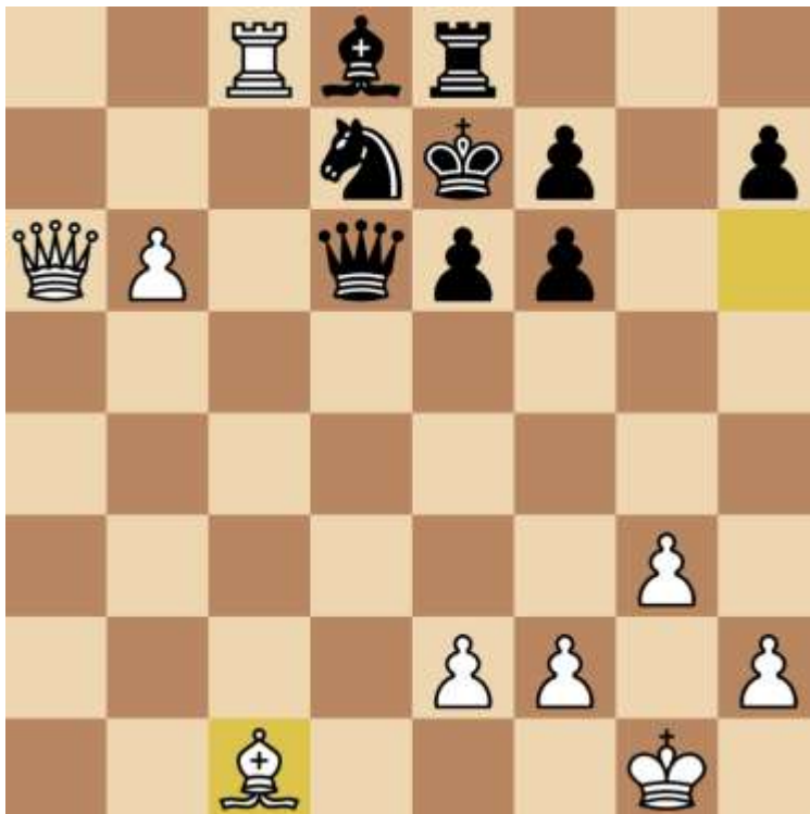
Stand na 31. Lc1

Ruud speelde 21. Kg1 en kwam met een ander idee. Een aantal zetten verder verrekende Ruud zich helaas.