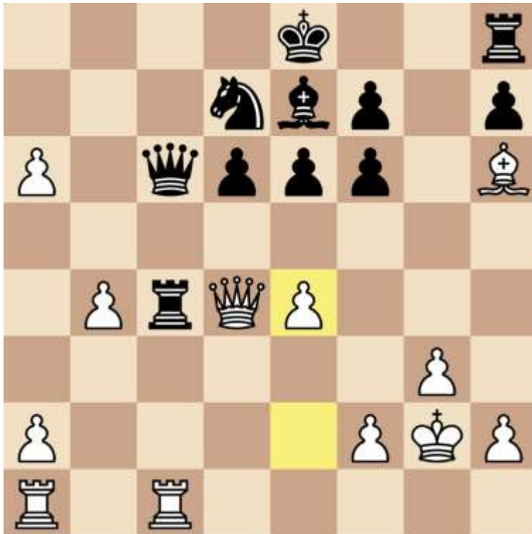
Stand na 21. e4

Overigens gevonden door onze commentator Merijn van Delft, kom even langs om zijn live analyses te volgen in het commentaanhok. Het idee is (onder andere) dat je na 21. ... Txc1 22. Txc1 Dxa6 23. a4 kan spelen en je pion op e2 niet hangt.