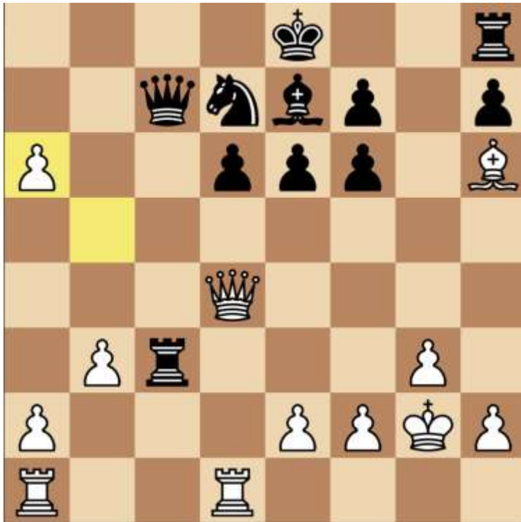
Stand na 18. bxa6

Het idee van dit offer is eigenlijk tweeledig. Omdat zwart onderontwikkeld is (zie bijvoorbeeld die toren op h8) heb je directe aanvalskansen. Dat kun je gaan doen met Tc1, welke toren is dan even de vraag. Daarnaast heb je drie vrijpionnen op de damevleugel en kun je proberen een dame te halen.