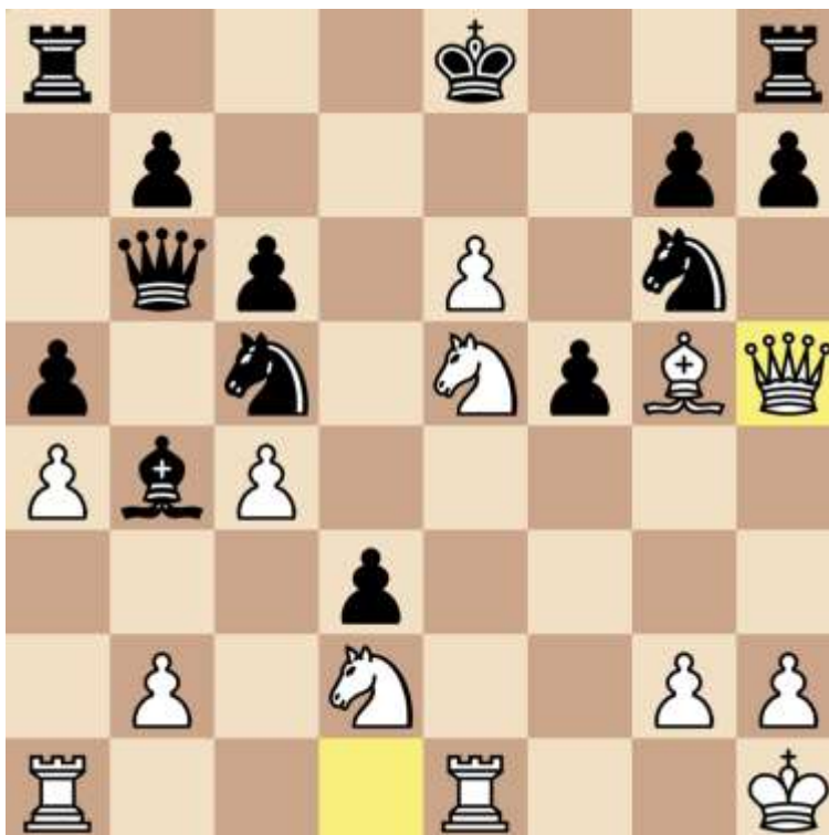
Stand na 20. Dh5

In onderstaande stand greep Ruud het initiatief definitief.