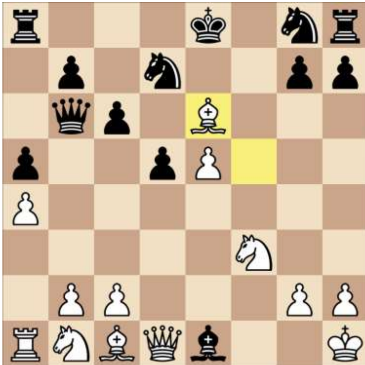
Stand na 13. Lxe6

moet je de looper redden (bv Lb4) en dreigt wit de aanval te zoeken met Pg5 gevolgd door Dh5. Waarschijnlijk de overweging om terug te slaan op f5: exf5. Gevolg: een wilde stelling met wisselende kansen.