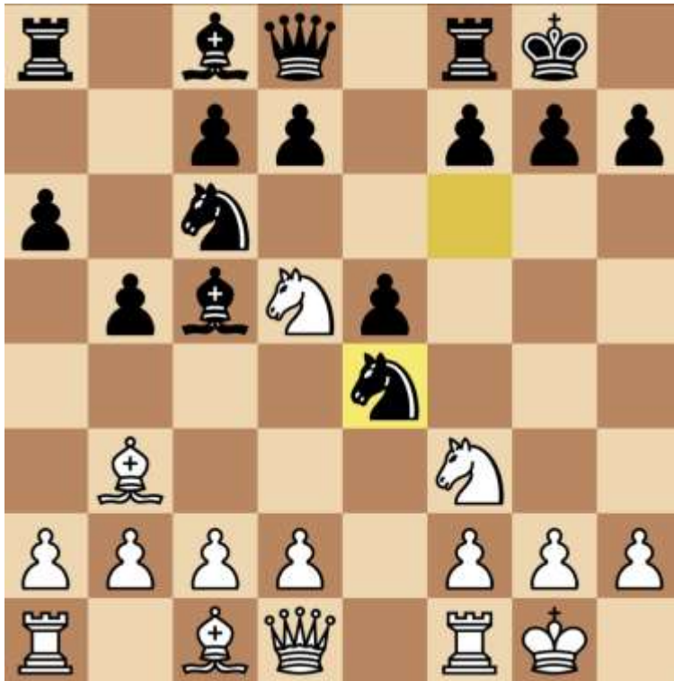
Stand na 8. Pxe4

Het typeert de ambitieuze schaker. Het pionoffer aannemen! De stelling leek ook goed verdedigbaar en lang leek Arthur de winst te gaan pakken. Tot de tijdnoed genadeloos toesloeg en hij in onderstaande stelling misgreep.