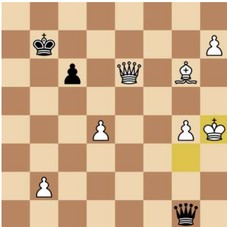
Stand na 59. Kh4

Uiteindelijk gaf Khoi op in onderstaande stand: