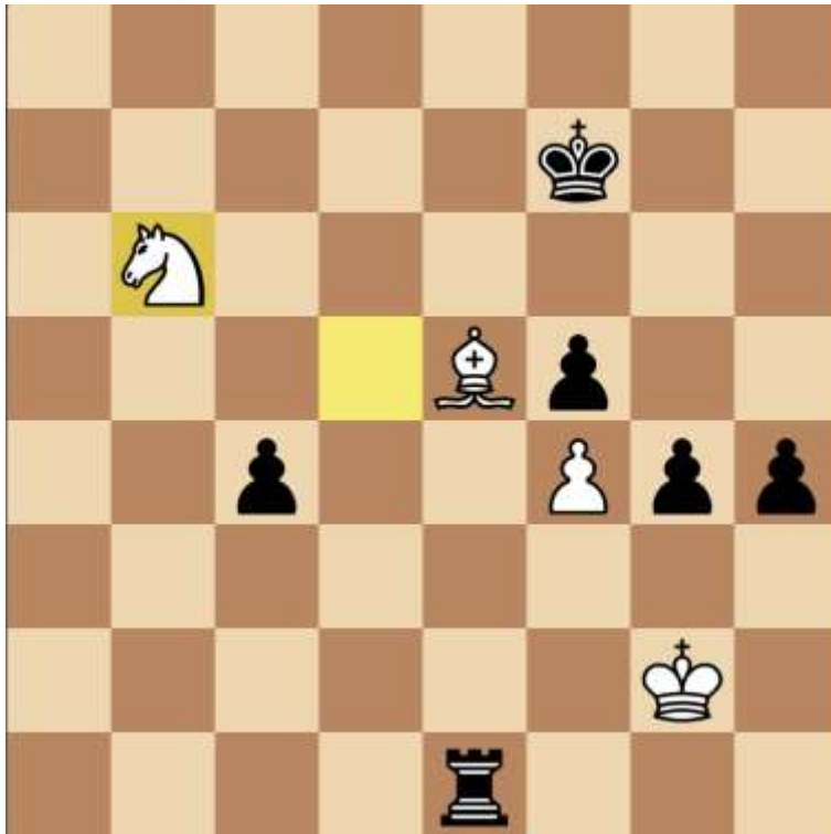
Stand na 52. Pb6

Gespeeld werd 52. ... Txe5! 53. fxe5 c3. En de pion is te stoppen, maar daarvoor moet wit e6+ spelen. Er volgde 54. e6+ Kxe6 55. Pa4 c2 56. Pc5+ (daarom e6) Kd5 57. Pd3 en in deze stand gaf wit beroofd van al zijn pionnen op. Vier pionnen zijn niet meer tegen te houden.