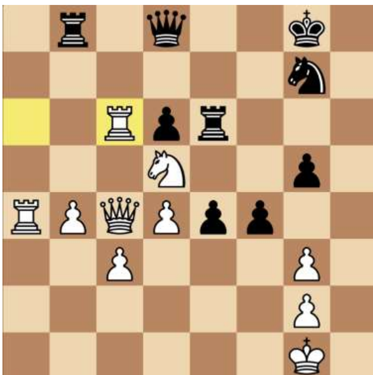
Stand na 34. Txc6

Het typeert de ambitieuze schaker. Het pionoffer aannemen! De stelling leek ook goed verdedigbaar en lang leek Arthur de winst te gaan pakken. Tot de tijdnoed genadeloos toesloeg en hij in onderstaande stelling misgreep.